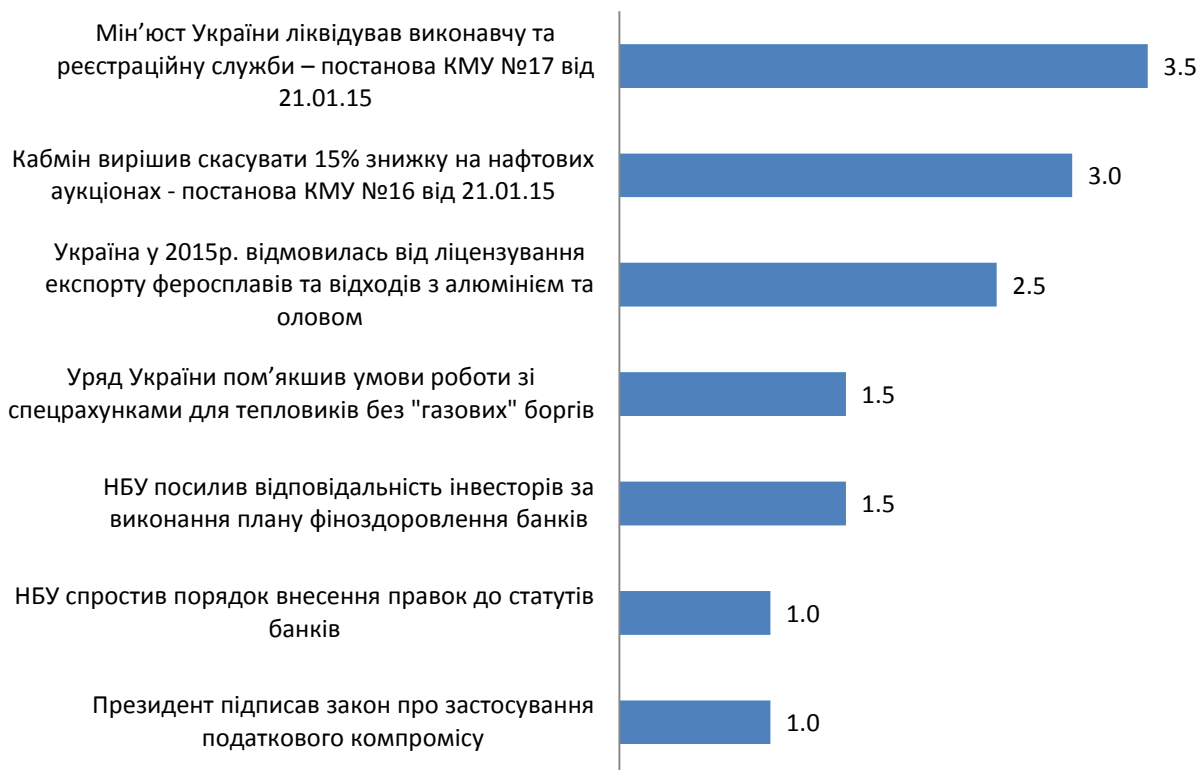
Графік 3. Події, що визначали значення індексу протягом 12-25 січня 2015 р. (оцінка події є сумою її оцінок за різними напрямками, тому вона може перевищувати +5, або бути меншою за -5 )