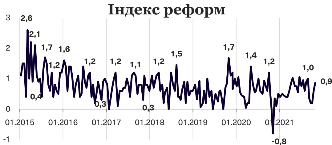
Графік 1. Динаміка Індексу моніторингу реформ

iMoRe може приймати значення від -5 до +5,