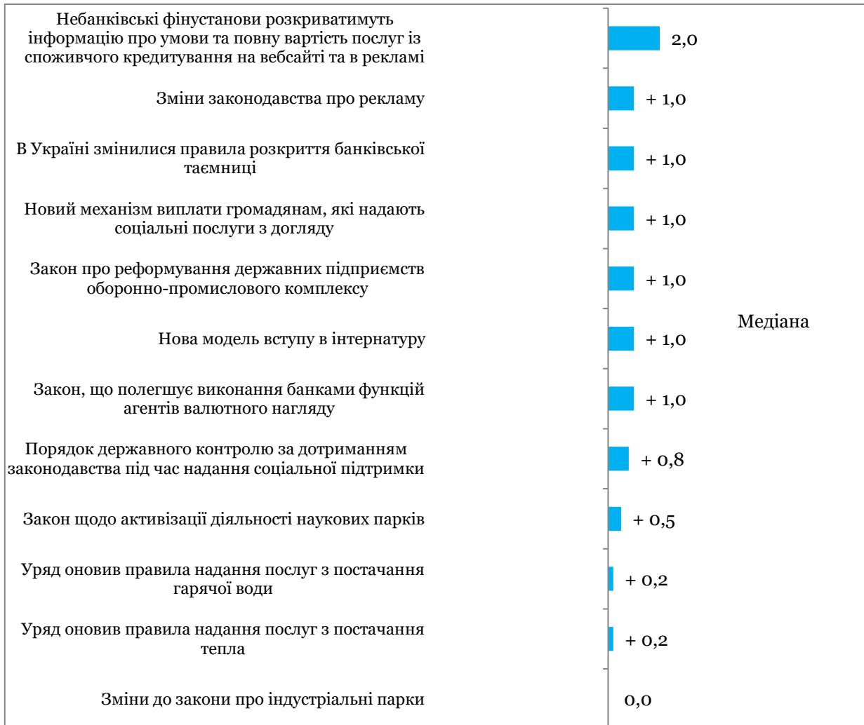
Графік 3. Події, що визначали значення індексу, оцінка події є сумою її оцінок за напрямками, тому вона може перевищувати +5, або бути меншою за -5