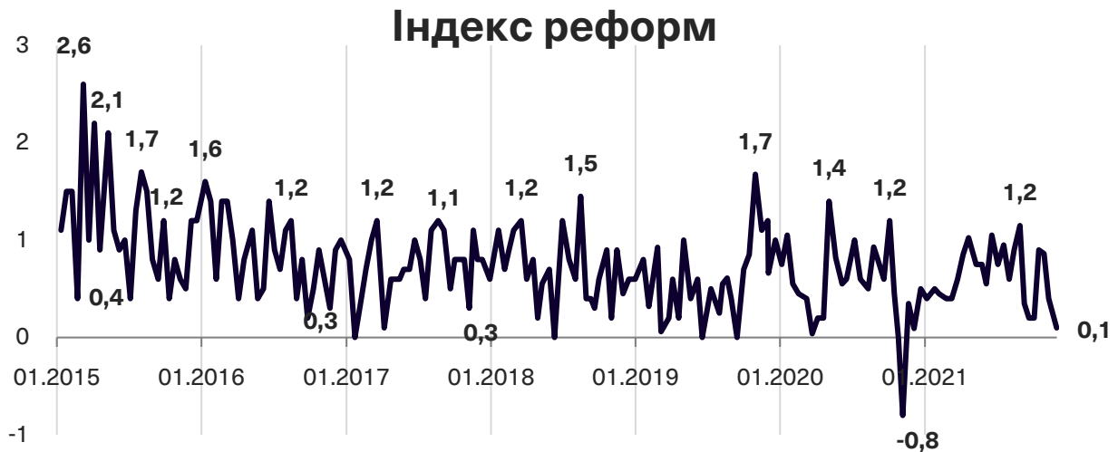
Графік 1. Динаміка Індексу моніторингу реформ

Індекс реформ може приймати значення від -5 до +5, значення вище за +2 розглядається як прийнятний темп реформ