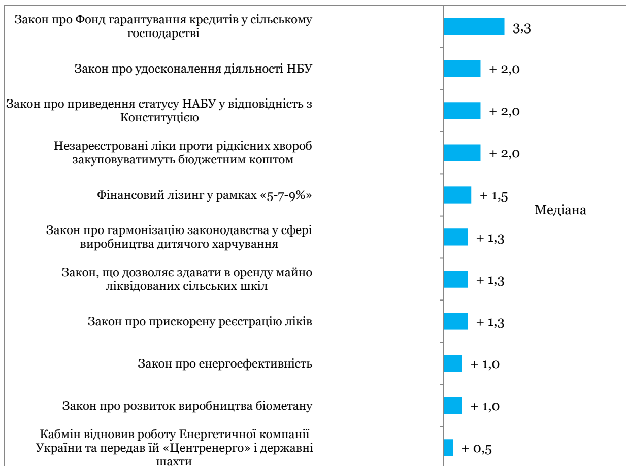
Графік 3. Події, що визначали значення індексу, оцінка події є сумою її оцінок за напрямками, тому вона може перевищувати +5, або бути меншою за -5