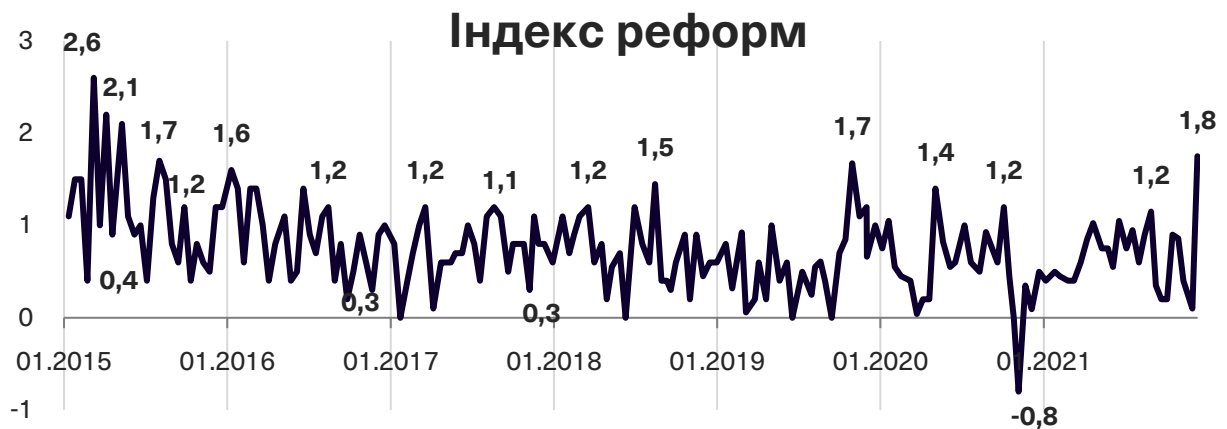
Графік 1. Динаміка Індексу моніторингу реформ

Індекс реформ може приймати значення від -5 до +5, значення вище за +2 розглядається як прийнятний темп реформ