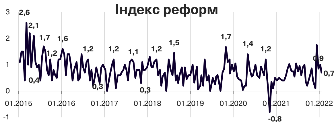
Графік 1. Динаміка Індексу моніторингу реформ

Індекс реформ може приймати значення від -5 до +5, значення вище за +2 розглядається як прийнятний темп реформ