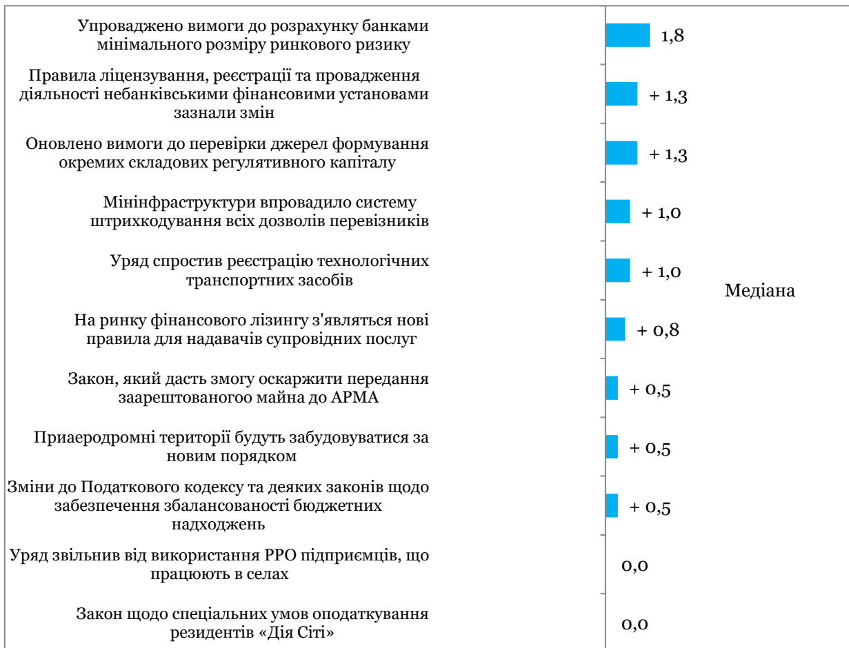
Графік 3. Події, що визначали значення індексу, оцінка події є сумою її оцінок за напрямками, тому вона може перевищувати +5, або бути меншою за -5