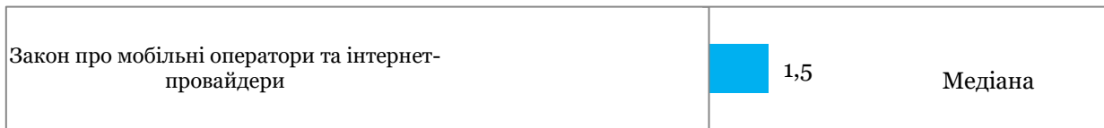
Таблиця 1. Оцінки всіх подій та прогресу реформ за напрямками

Графік 3. Події, що визначали значення індексу, оцінка події є сумою її оцінок за напрямками, тому вона може перевищувати +5, або бути меншою за -5