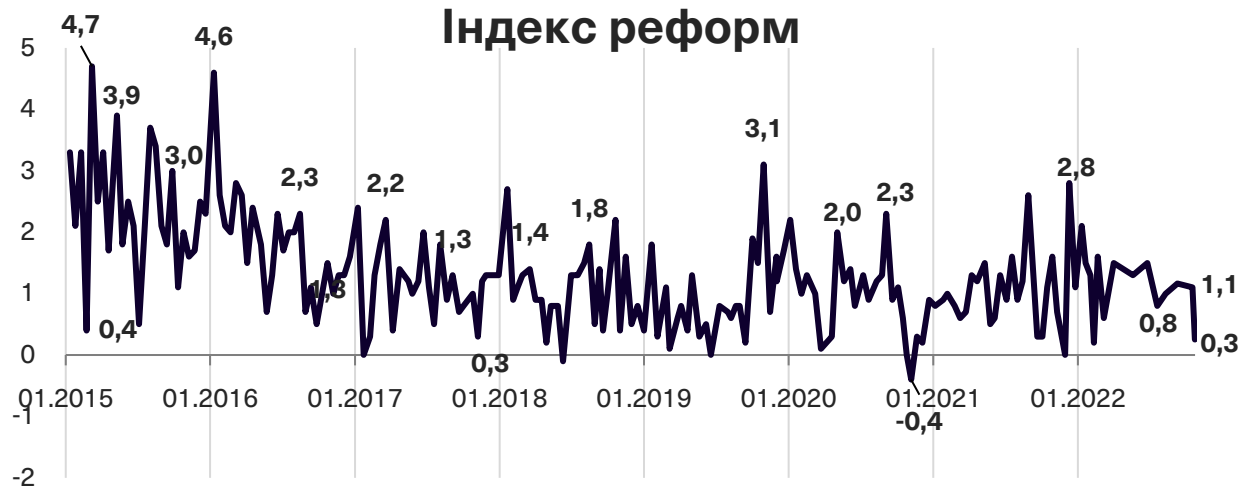
Графік 1. Динаміка Індексу моніторингу реформ

Індекс реформ може приймати значення від -5 до +5, значення вище за +2 розглядається як прийнятний темп реформ