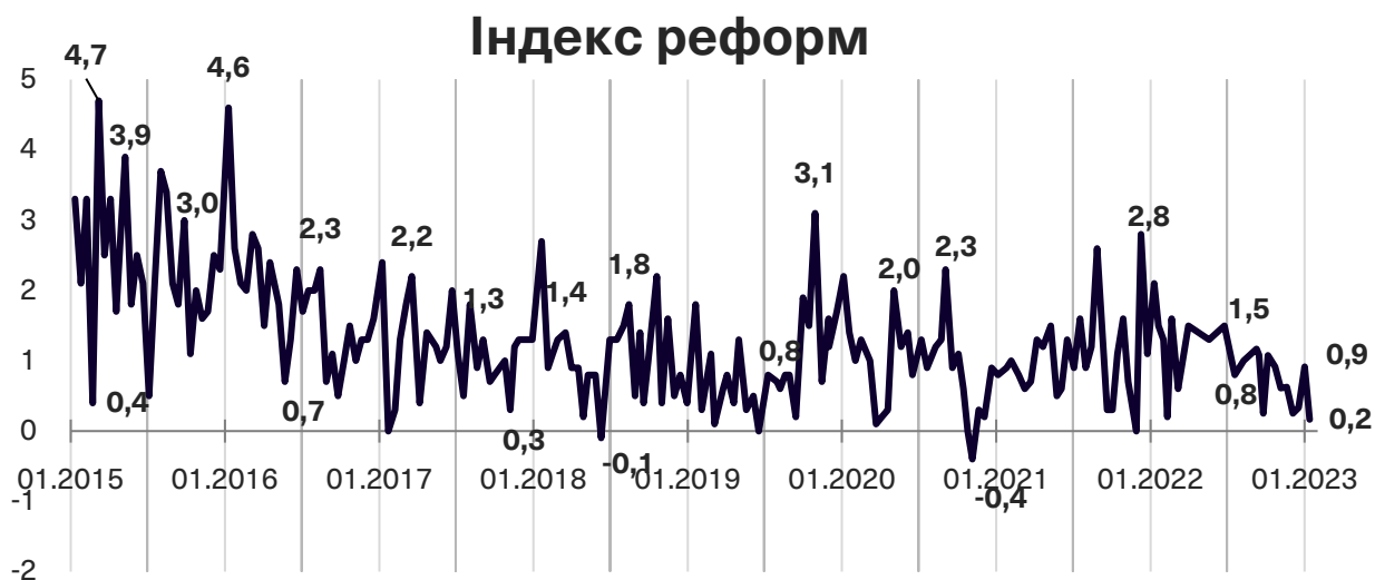
Графік 1. Динаміка Індексу моніторингу реформ

Індекс реформ може приймати значення від -5 до +5, значення вище за +2 розглядається як прийнятний темп реформ