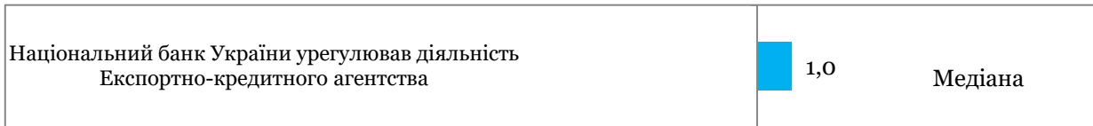
Таблиця 1. Оцінки всіх подій та прогресу реформ за напрямками