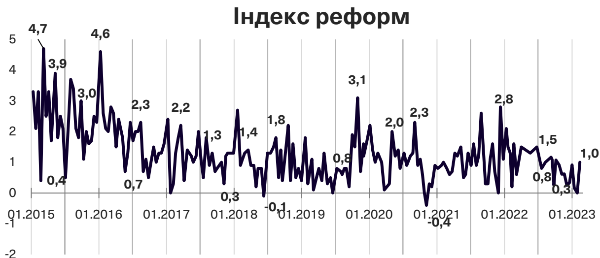
Графік 1. Динаміка Індексу моніторингу реформ

Індекс реформ може приймати значення від -5 до +5, значення вище за +2 розглядається як прийнятний темп реформ