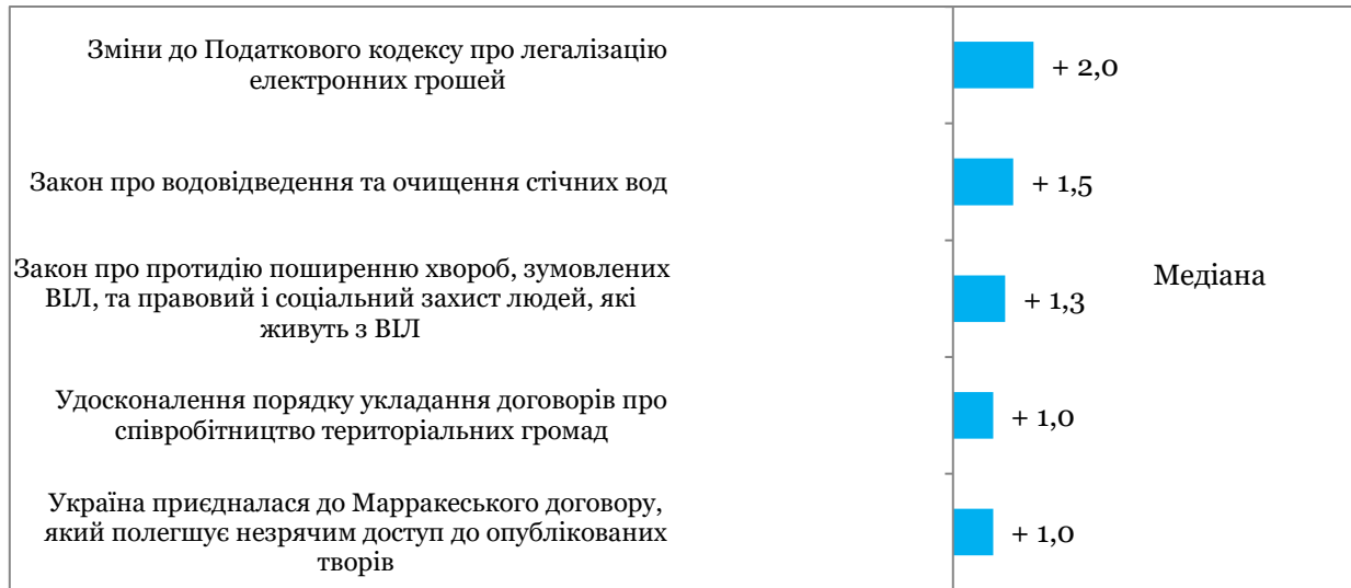
Таблиця 1. Оцінки всіх подій та прогресу реформ за напрямками