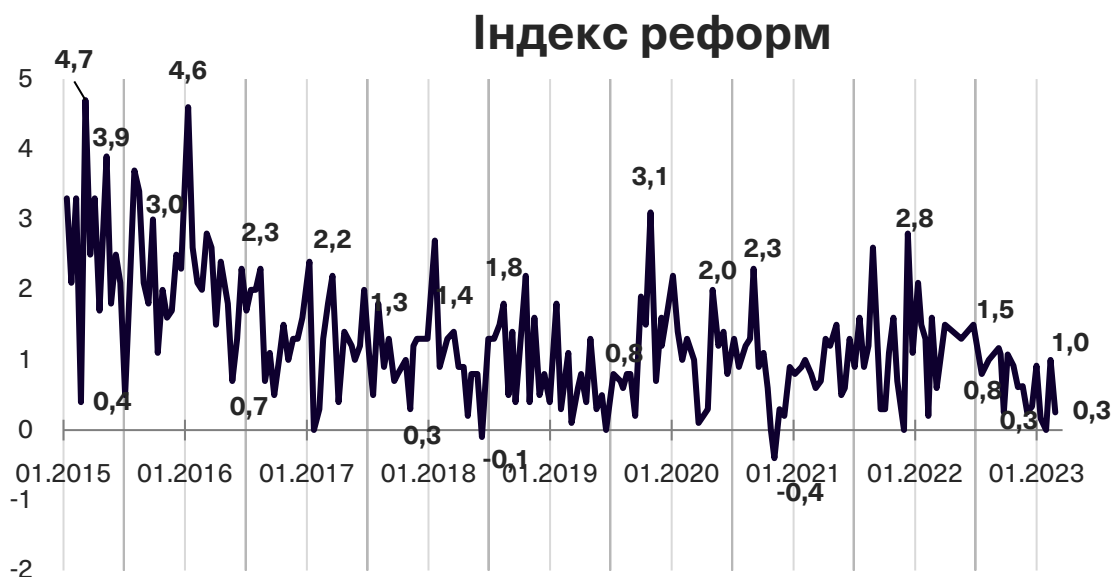
Графік 1. Динаміка Індексу моніторингу реформ

Індекс реформ може приймати значення від -5 до +5, значення вище за +2 розглядається як