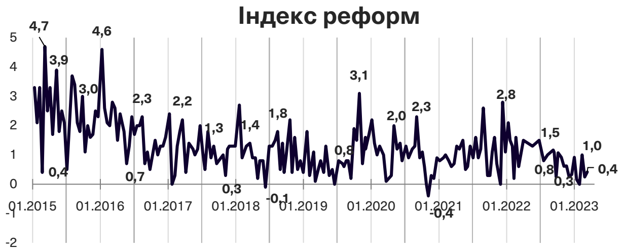
Графік 1. Динаміка Індексу моніторингу реформ

Індекс реформ може приймати значення від -5 до +5, значення вище за +2 розглядається як прийнятний темп реформ