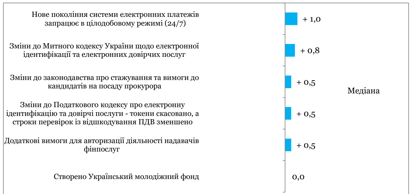
Графік 3. Події, що визначали значення індексу, оцінка події є сумою її оцінок за напрямками, тому вона може перевищувати +5, або бути меншою за -5